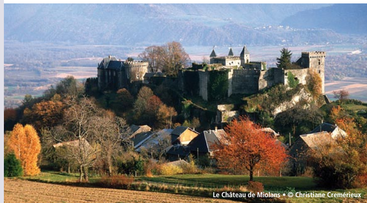
Le Château de Miolans

Au XIX ème et au XX ème siècles, de nombreuses fortifications vont se développer, comme elles s'étaient déjà développées lors des siècles précédents, tout au long de ce qui deviendra la frontière franco italienne, du nord des Alpes à la Méditerranée. Solidement bâties, fièrement campées en des sites précieux, ces fortifications traduisant l'audace et l'habileté des architectes militaires, sont impressionnantes et attirantes, justifiant leur restauration, non plus à des fins militaires, mais dans un but touristique, leur découverte laissant le visiteur ébloui, comme au niveau de la barrière de l'Esseillon.